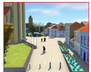
P 20 OPENING VERNIEUWDE KLEINE MARKT