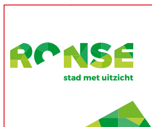
P 8 STAD EN OCMW PAKKEN UIT MET NIEUW LOGO