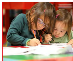
P 14 RONSE WERELDSTAD EN KUNSTENDAG VOOR KINDEREN