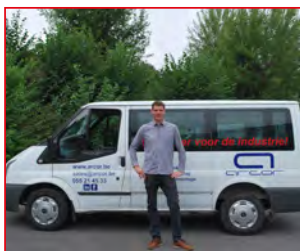
P 4 ARCOR BIJDT WERK OP MAAT