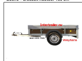
Plat zeil Bache plate