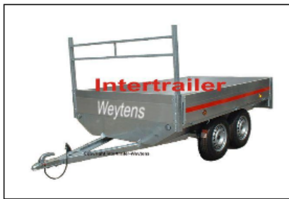
Aanhangwagen dubbelas met afneembare aluminiumdeuren Remorque ridelles aluminium escamotables