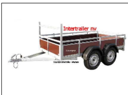
Aanhangwagen dubbelas met V-dissel Remorque deux essieux timon en V