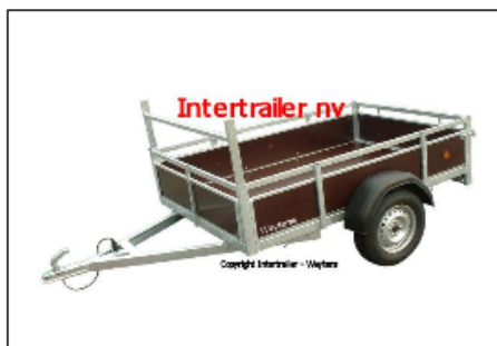
Aanhangwagen enkelas met V-dissel Remorque simple essieu timon en V