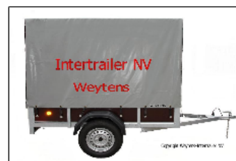
Huif + kader 150 cm hoogte Bache + arceaux hauteur 150 cm