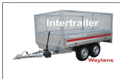
Traliewerk warm verzinkt 70 cm hoog Jeux de grilles galvanisées hauteur 70 cm